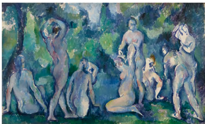
Paul Cezanne Groupe de baigneuses, ca. 1895 Huile sur toile, 47 x 77 cm Ordrupgaard, Copenhagen