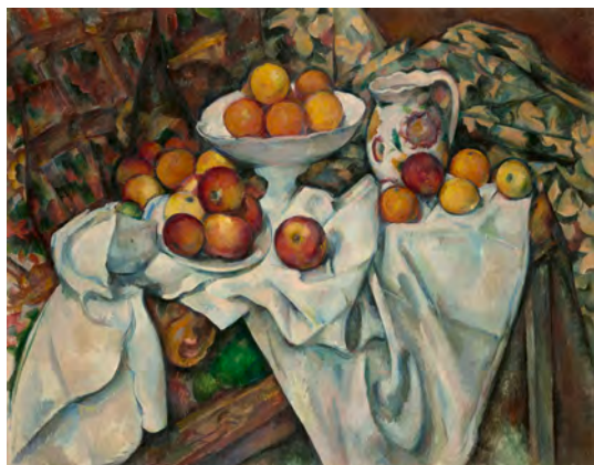
Paul Cezanne Pommes et oranges, ca. 1899 Huile sur toile, 74 x 93 cm Musée d'Orsay, Paris