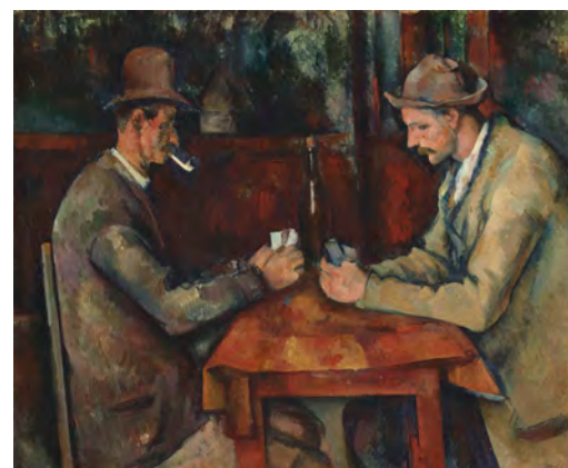
Paul Cezanne Les joueurs de cartes, 1893-1896 Huile sur toile, 47 x 56,5 cm Musée d'Orsay, Paris