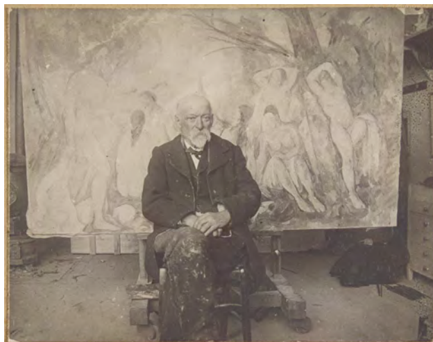
Paul Cezanne assis dans son atelier des Lauves Paris, musée d'Orsay

Images de presse: www.fondationbeyeler.ch/fr/medias/images-de-presse