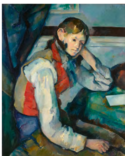
Paul Cezanne Le garçon au gilet rouge, 1888-1890 Huile sur toile, 79,5 x 64 cm Collection Emil Bührle, prêt à long terme au Kunsthaus Zürich