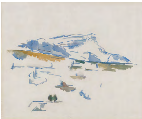
Paul Cezanne La Montagne Sainte-Victoire vue des Lauves, um 1904 Huile sur toile, 54 x 65 cm Collection privée, Derbyshire