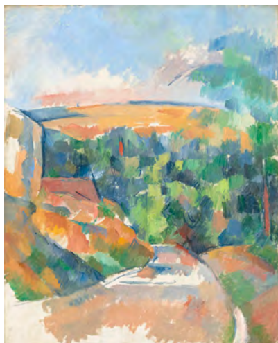
Paul Cezanne La route tournante (Matinée de printemps à Saint-Antonin), 1900-1906 Huile sur toile, 82,1 x 66 cm National Gallery of Art, Washington D. C., Collection Mr. et Mrs. Paul Mellon, 1985