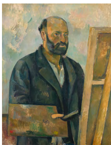
Paul Cezanne Portrait de l'artiste à la palette, um 1890 Huile sur toile, 92 x 73 cm Collection Emil Bührle, prêt à long terme au Kunsthaus Zürich

Images de presse: www.fondationbeyeler.ch/fr/medias/images-de-presse