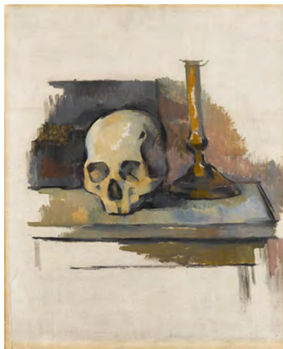
Paul Cezanne Nature morte avec crâne et chandelier, um 1900 Huile sur toile, 61 x 50 cm Staatsgalerie Stuttgart, acquis en 1955