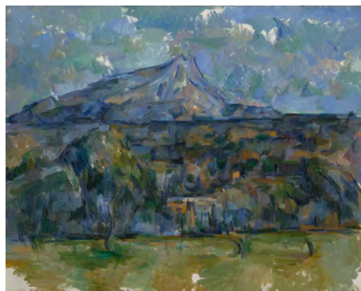
Paul Cezanne La Montagne Sainte-Victoire vue des Lauves, 1904/05 Huile sur toile, 63,8 x 81,6 cm The Nelson-Atkins Museum of Art, Kansas City, Missouri, purchase William Rockhill Nelson Trust